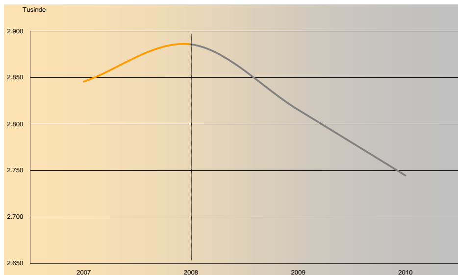
FIGUR 1: BESKÆFTIGELSEN I DANMARK (ANTAL PERSONER)